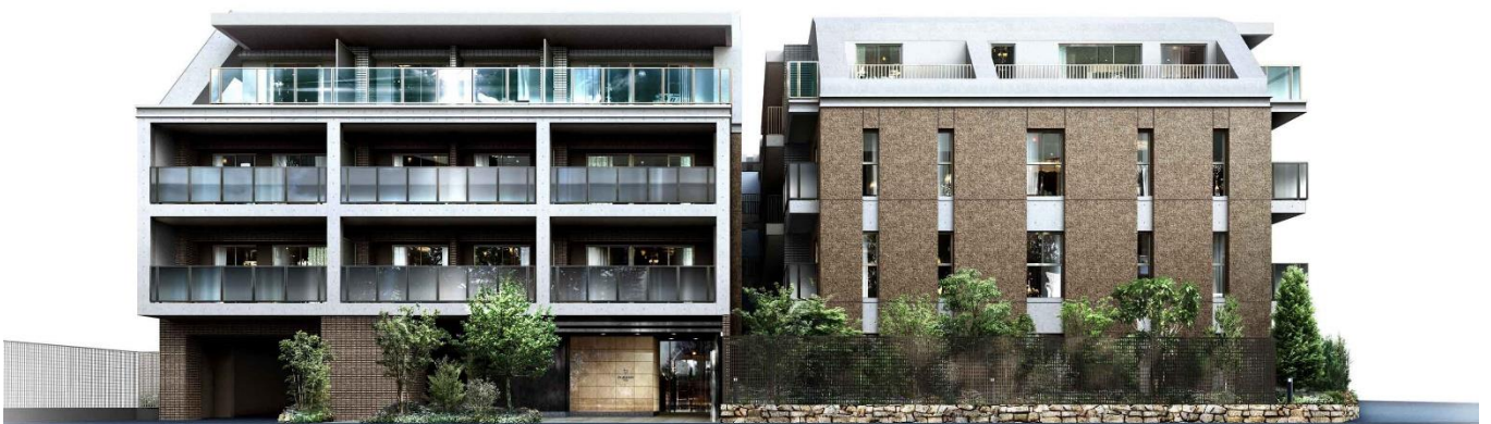
【「プレミスト平和台」完成予想パース】

※7. 建築物省エネルギー性能表示制度のことで、新築・既存の建築物において、省エネ性能を第三者評価機関が評価し、認定する制度。