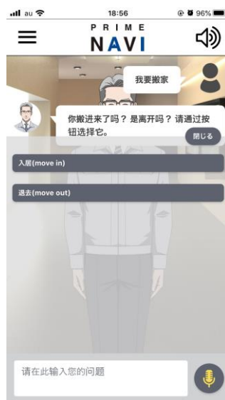
多言語対応画面 ※イメージ