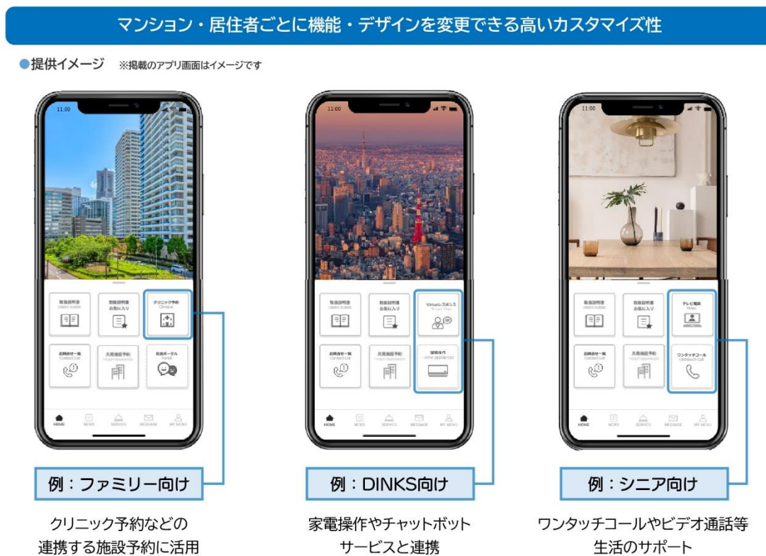
[図1：アプリ Station 提供イメージ]

創業から20年以上にわたり、集合住宅向けインターネット接続サービスや「入居者専用ページ」などの周辺サービスを50万世帯に提供するなかで、事業者様から「購入者と長く接点を持ちたい」「DXのために顧客管理をしたい」「入居者向けサービスを拡充したい」といったご要望やご相談を数多くいただいたことを受け、開発に着手いたしました。同時に、入居者からの「紙でのやりとりが多く煩雑」「サービスごとにアプリや会員登録があって管理できない」といった声も参考に、プロトタイプを用いた提供と改良を繰り返しながら約6年かけて開発したサービスです。