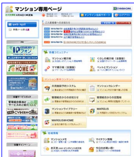
・マンション専用ページ