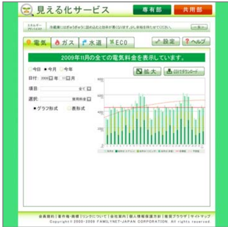
(専有部) グラフ:表示例