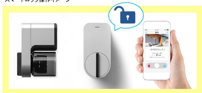
スマートロック操作イメージ

※ 様々な物に通信機能を持たせることで、インターネットに接続したり相互に通信すること