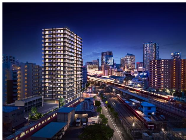
「プライムスタイル川崎」完成イメージ図

参考URL： https://www.keikyu.co.jp/company/news/2019/20191126HP_19182EW.html