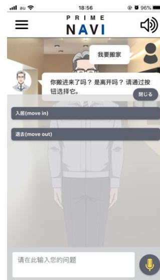
多言語対応画面 ※イメージ