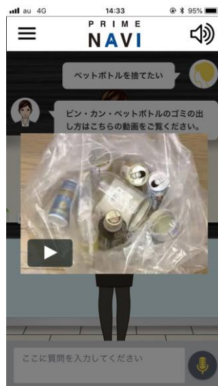
居住者対応画面 ※イメージ