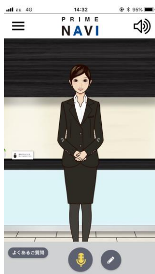
アプリTOP画面 ※イメージ